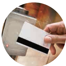
СИСТЕМЫ КОНТРОЛЯ ДОСТУПА