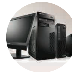
ТОНКИЕ КЛИЕНТЫ И РАБОЧИЕ СТАНЦИИ